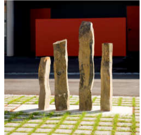
4 Basalt-Stelen, teilweise angeschliffen, so dass der schwarze Kern sichtbar wird. Darauf hat Oliver Köhl Fingerabdrücke eingehauen und vergoldet.

Köhl: Ich habe einen Lehrauftrag an der Kunstakademie in Bad Reichenhall, so dass ich mehrmals im Jahr dort für eine Zeit unterrichte. Und zuletzt gibt es die vielen Aufträge mit angewandten Arbeiten, z. B. Kunst am Bau. Eine Arbeit in Stein „Adam“ befindet sich in der Polizeiinspektion in Marktoberdorf (siehe Foto).