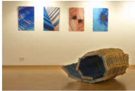
Fotocollagen im Hintergrund, Holzplastik im Vordergrund

Köhl: Zunächst einmal besteht meine Arbeit darin, jeden Tag sehr fleißig in meinem Atelier tätig zu sein. Daraus ergibt sich erst die Teilnahme an ausgeschriebenene Ausstellungen, wie gerade die Festwochen – Kunstausstellung in Kempten. Von 497 Einreichungen wurden diesmal 76 Werke angenommen. Da kann man immer nur froh sein, wenn man dabei ist. Zu sehen war meine Zeichnung „Fire in Cairo“. An vielen jurierten Wettbewerben und Ausstellungen im In- und Ausland nehme ich teil und freue mich sehr, wenn meine Arbeiten auch einmal prämiert werden, wie zum Beispiel meine Holzplastik „Blue Spirit“ (siehe Foto),